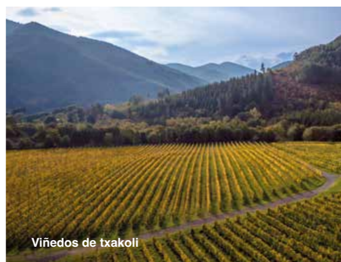
Viñedos de txakoli