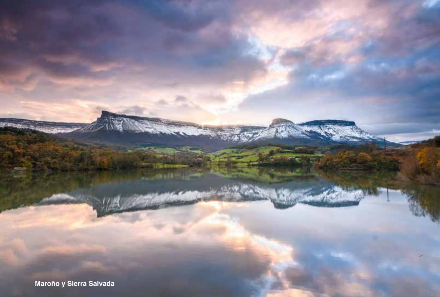
Maroño y Sierra Salvada

Uno de los recursos imprescindibles de la comarca de Aiaraldea es el Salto del Nervión , nacedero del río del mismo nombre, origen de la que luego será la Ría de Bilbao. Su cascada de 220 metros es la más alta de la Península. Puede verse desde el mirador de la parte alta o desde abajo atravesando el Cañón de Delika . Llegar al mirador es muy fácil y accesible para todos los públicos y las vistas no os dejarán indiferentes.