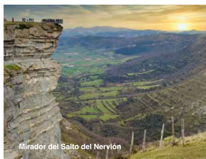
Mirador del Salto del Nervión