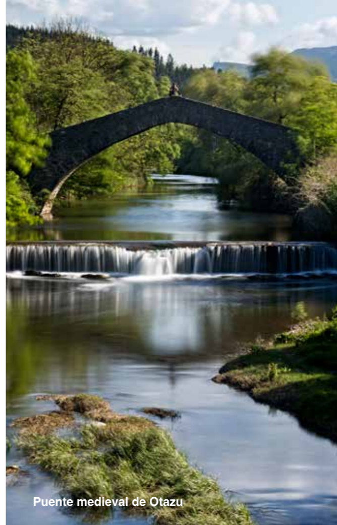
Puente medieval de Otazu

También podréis encontraros con loberas, unas curiosas construcciones peculiares de la zona, muchas de ellas conservadas en buen estado y desde las que se permite observar e interpretar plenamente el sistema ancestral para cazar a los lobos. Son conocidas las loberas de Gibijo, Monte Santiago y la de San Miguel.