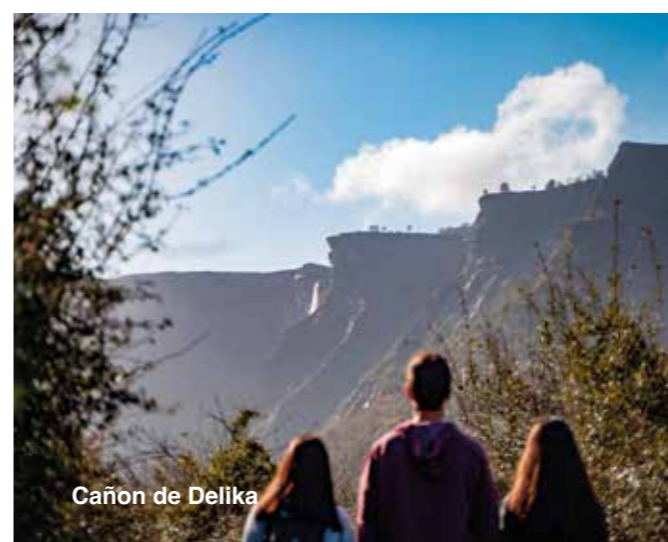
Cañón de Delika