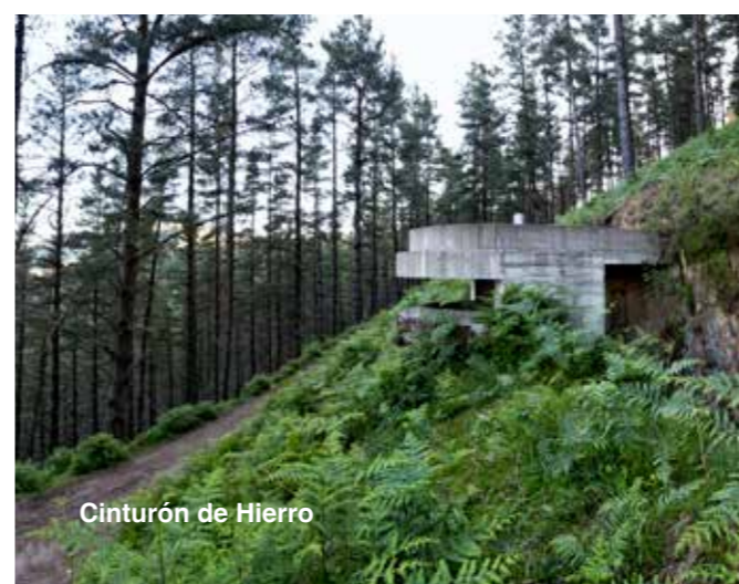
Cinturón de Hierro