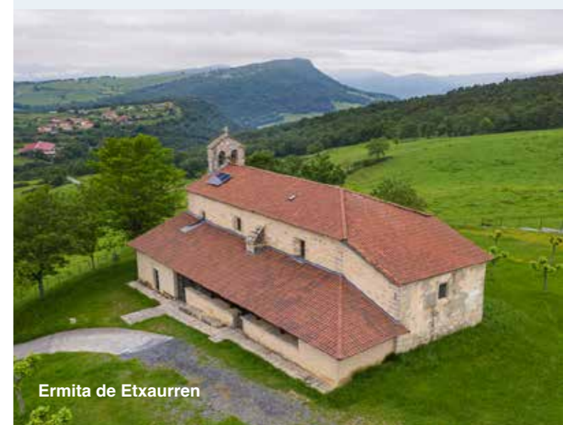
Ermita de Etxaurren

El río Nervión que durante años ha sido la unión de pequeñas y grandes industrias de la zona, se ha transformado en la última década dejando paso a un entorno atractivo y ambientalmente cuidado, que en la actualidad podemos disfrutar a lo largo del Parque Lineal del Nervión . Este paseo de 10 kilómetros permite conocer a través de un tranquilo recorrido las localidades de Laudio/Llodio, Ayala/Aiara y Amurrio, caseríos repletos de historia y belleza natural. Es muy apropiado para realizar tanto a pie como en bicicleta, con una baja dificultad.