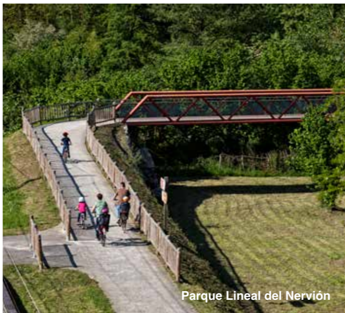
Parque Lineal del Nervión

Otra ruta que te proponemos es la del Parque Lineal del Nervión , diez kilómetros que forman parte de la historia y de la vida de las gentes de la comarca, muestra de ello son el punto Medieval de Otazu , en otro tiempo puerta de entrada a la localidad de Luiaondo y el de Zubiaurre o las actuales pasarelas que se pueden recorrer también en bici.