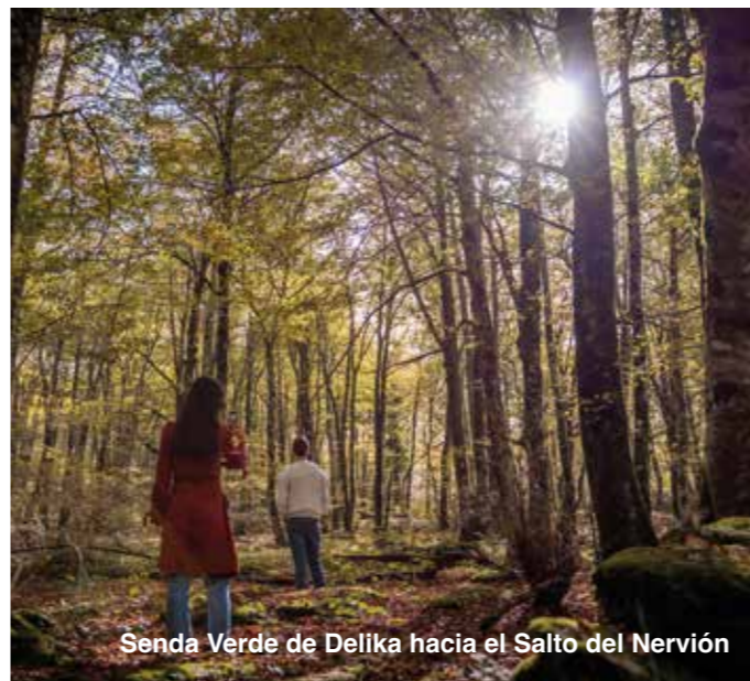
Senda Verde de Delika hacia el Salto del Nervión