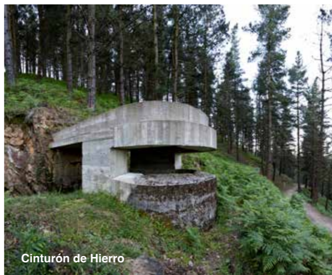
Cinturón de Hierro

Para la familia es una buena alternativa el parque de Goikomendi-Kuxkumendi .