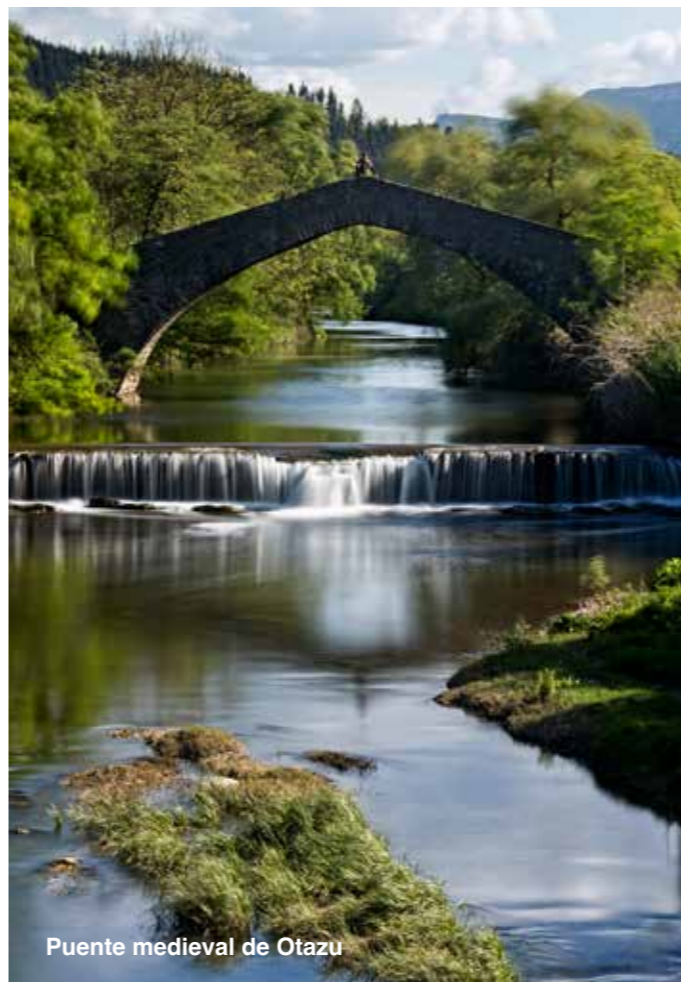
Puente medieval de Otazu