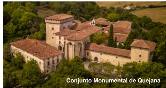
Conjunto Monumental de Quejana

Vinculado desde el origen a la familia de los Ayala está formado por el Palacio, el convento e Iglesia de San Juan Bautista y la Torre-Capilla de la Virgen del Cabello donde destaca el pan-teón familiar y la réplica del retablo cuyo original se encuentra en la actualidad en Chicago.