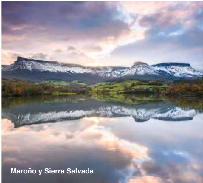
Maroño y Sierra Salvada

Recortando el cielo, detrás del embalse está la Sierra Salvada o Gorobel , un gran macizo rocoso de 300 metros de desnivel.