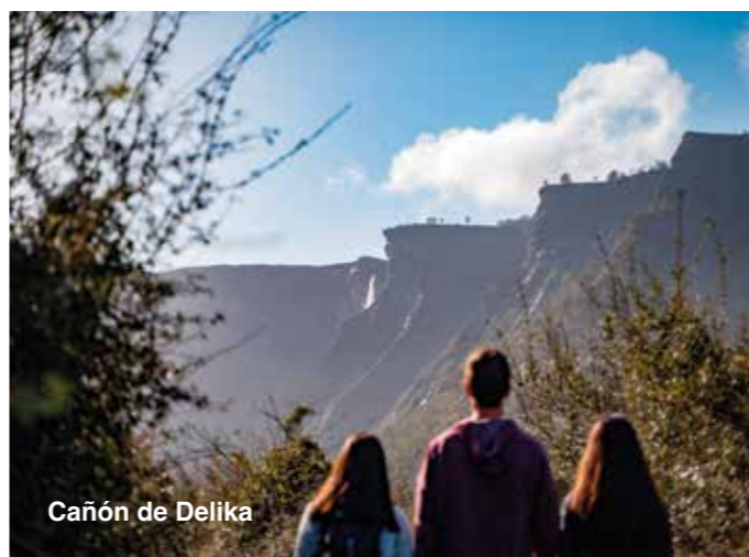
Cañón de Delika

Para senderistas la GR del Camino Real de la Sopena y la Ruta del Pastoreo , además buenas propuestas son la Ruta Circular de Aspaltza , el Cinturón de Hierro o los 12 km. de la Ruta de Garrastatxu .