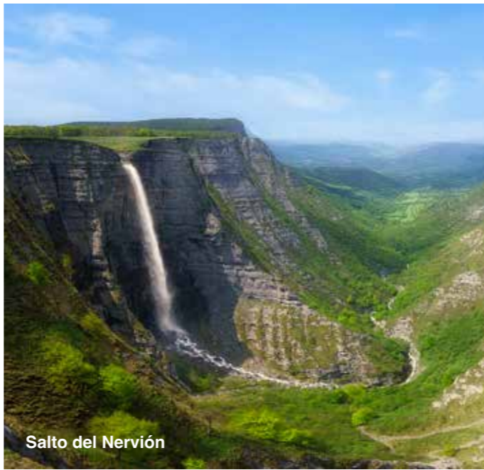
Salto del Nervión

Una visita imprescindible es el Salto del Nervión , nacedero del río del mismo nombre y que se convierte en Ría a su llegada a Bilbao. Su cascada de 220 m es la más alta de la Península y está en la frontera de las provincias de Burgos, Bizkaia y Araba. Puede verse desde el mirador en la parte alta o desde el Cañón de Delika en su base.