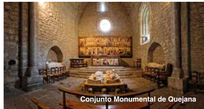
Conjunto Monumental de Quejana

Otro conjunto de interés y ubicado en un paraje natural privilegiado es el que forma el Santuario de Santa María del Yermo y la Ermita de Santa Lucía , todo recibe el nombre de Ermualde , paraje natural privilegiado con excelentes vistas al valle, en Laudio/Llodio.