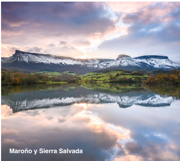
Maroño y Sierra Salvada

Recortando el cielo, detrás del embalse está la Sierra Salvada o Gorobel , un gran macizo rocoso de 300 metros de desnivel.