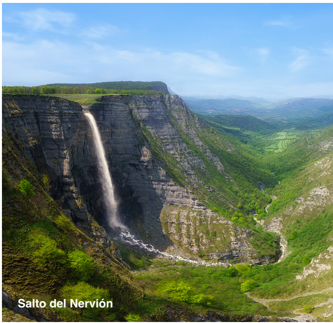
Salto del Nervión

Una visita imprescindible es el Salto del Nervión , nacedero del Río del mismo nombre y que se convierte en Ría a su llegada a Bilbao. Su cascada de 220 mts. es la más alta de la Península y está en la frontera de las provincias de Burgos, Bizkaia y Araba. Puede verse desde el mirador en la parte alta o desde el Cañón de Delika en su base.