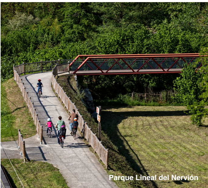
Parque Lineal del Nervión

Otra ruta que te proponemos es la del Parque Lineal del Nervión , diez kilómetros que forman parte de la historia y de la vida de las gentes de la comarca, muestra de ello son el punto Medieval de Otazu , en otro tiempo puerta de entrada a la localidad de Luiaondo y el de Zubiaurre o las actuales pasarelas que se pueden recorrer también en bici.