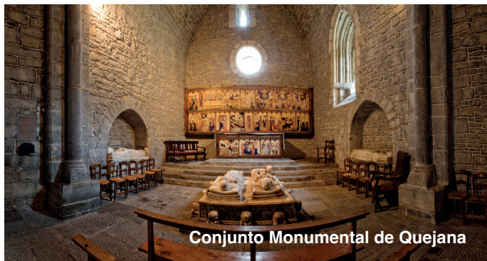
Conjunto Monumental de Quejana

Otro conjunto de interés y ubicado en un paraje natural privilegiado es el que forma el Santuario de Santa María del Yermo y la Ermida de Santa Lucía , todo recibe el nombre de Ermualde , paraje natural privilegiado con excelentes vistas al valle.