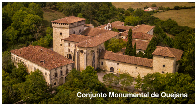
Conjunto Monumental de Quejana

El Conjunto Monumental de Quejana que está catalogado como Monumento Nacional del País Vasco en 1984. Vinculado desde el origen a la familia de los Ayala está formado por el Palacio, el convento e Iglesia de San Juan Bautista y la Torre-Capilla de la Virgen del Cabello donde destaca el panteón familiar y la réplica del retablo cuyo original se encuentra en la actualidad en Chicago.