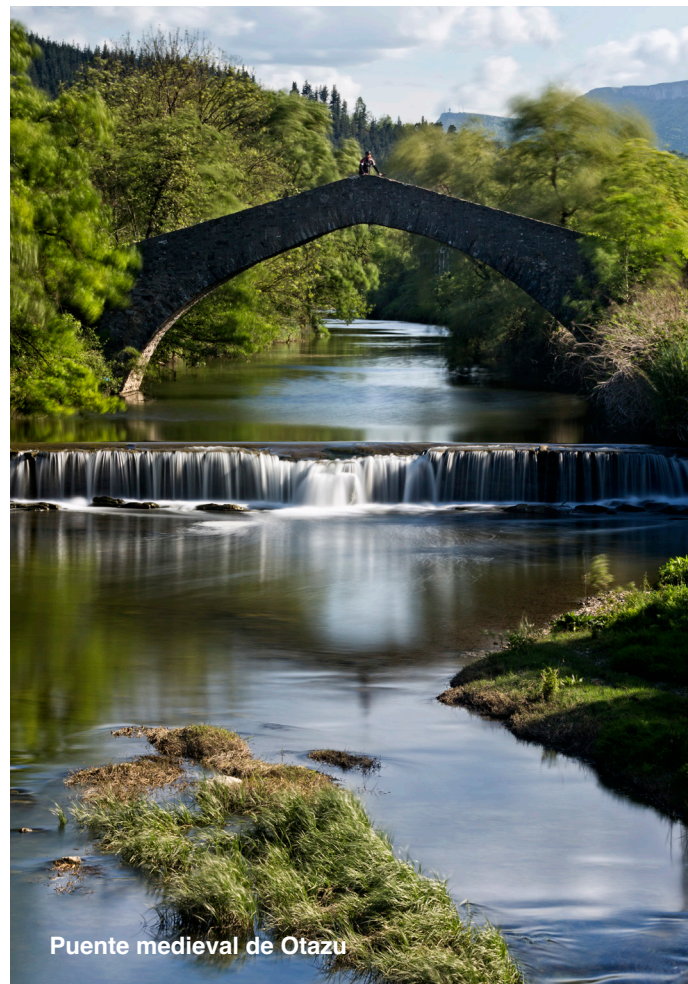
Puente medieval de Otazu