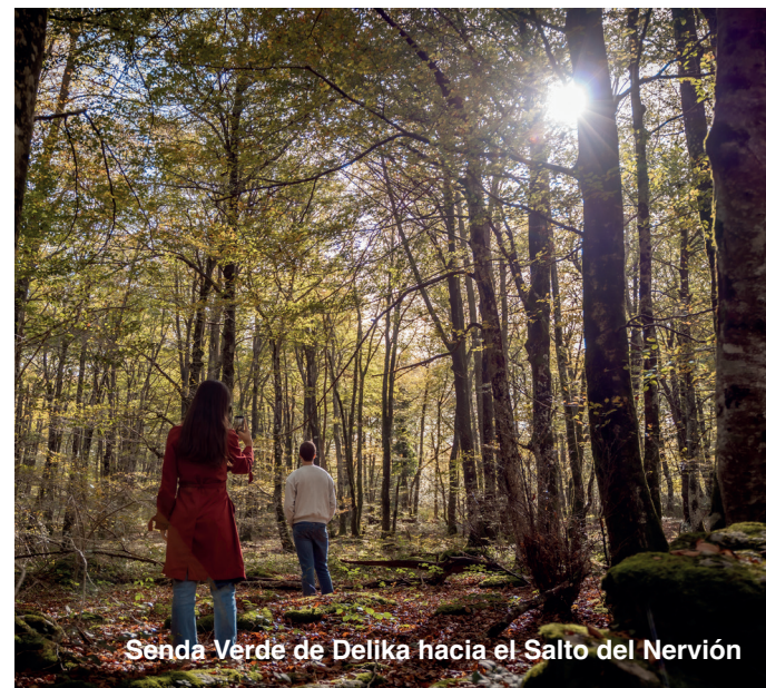
Senda Verde de Delika hacia el Salto del Nervión