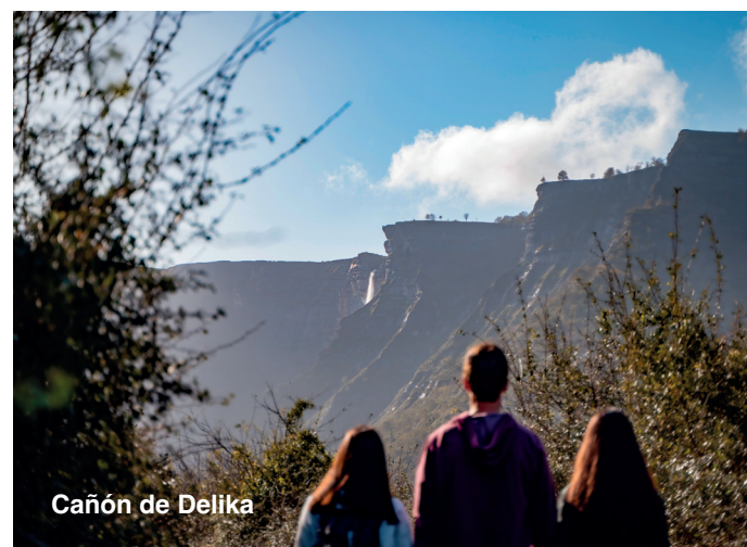
Cañón de Delika

Para senderistas la GR del Camino Real de la Sopeña y la Ruta del Pastoreo , además buenas propuestas son la Ruta Circular de Aspaltza , el Cinturón de Hierro o los 12 km. de la Ruta de Garastatxu .