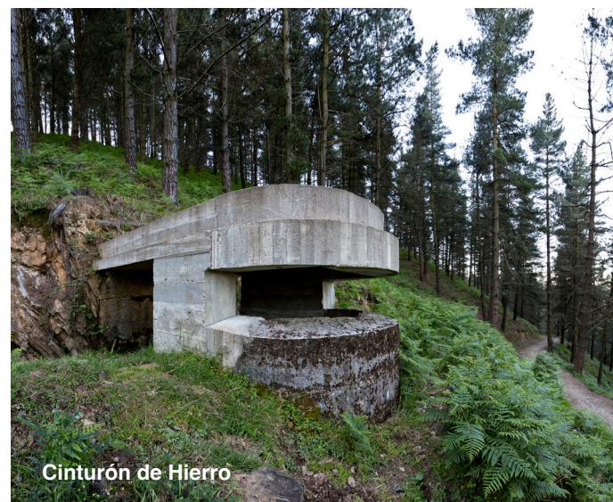
Cinturón de Hierro

Para la familia es una buena alternativa el parque de Goikomendi-Kuxkumendi .